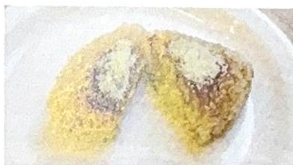
▲「チーズ焼きおにぎり」香ばしく、中までチーズがたっぷり